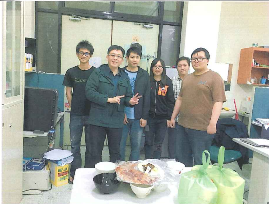
活動照片 (兩至四張)