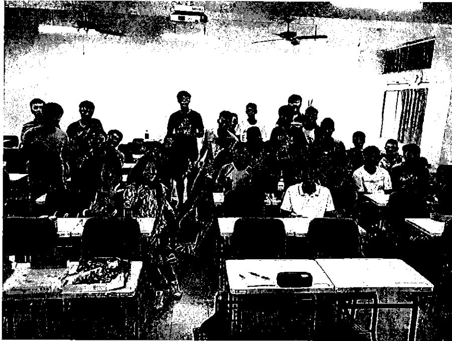
活動照片 (兩至四張)