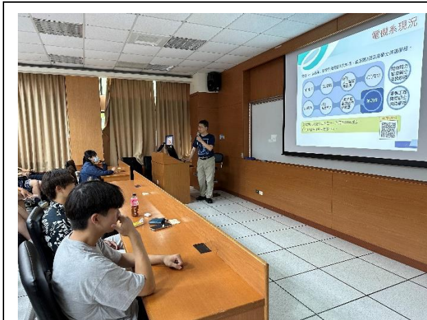
工 EC6019 系主任時間、系學會時間