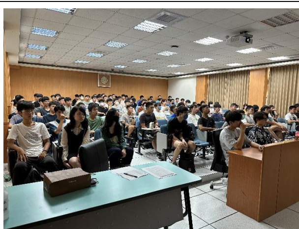
工 EC6019 系主任時間、系學會時間