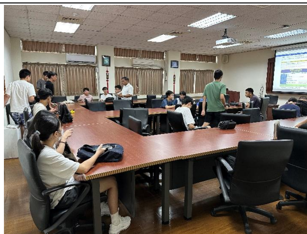
工 EC6011 全英班導師時間 (新可夫老師)