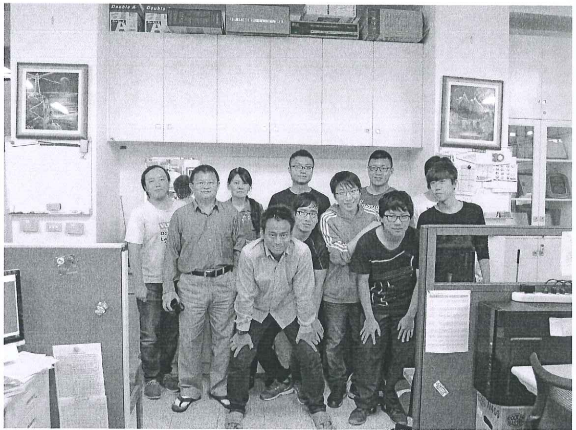
活動照片 (兩至四張)