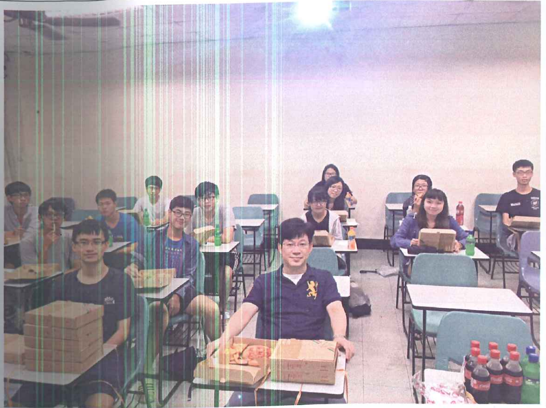
活動照片 (兩至四張)